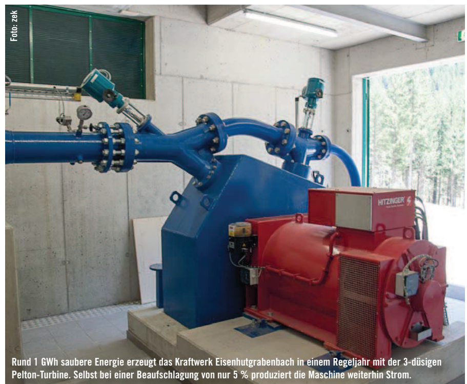
Rund 1 GWh saubere Energie erzeugt das Kraftwerk Eisenhutgrabenbach in einem Regeljahr mit der 3-düsigen Pelton-Turbine. Selbst bei einer Beaufschlagung von nur 5 % produziert die Maschine weiterhin Strom.

Das in Stahlbetonbauweise errichtete Krafthaus befindet sich orographisch am linken Ufer des Eisenhutgrabenbachs. Es wurde wie die Wasserfassung durch die Firma Guster errichtet und mit einem Satteldach sowie einer Lärchenholzschalung versehen. Nach